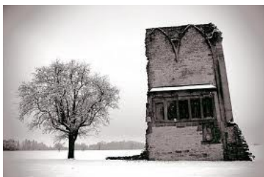
Anhäuser Mauer im Winter

Samstag, 24. Februar um 18.00 Uhr Stunde der Kirchenmusik