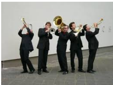
Hohenlohe Brass Quintett

Samstag, 28. April um 18.00 Uhr HOHENLOHE BRASS QUINTETT Werke für Blechbläser Alter und Neuer Meister