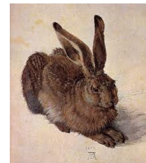
Osterhasi von Dürer

Ostersonntag, 1. April um 5.00 Uhr MUSIKALISCHE OSTERNACHT mit dem Ensemble für Liturgie & Gottesdienst